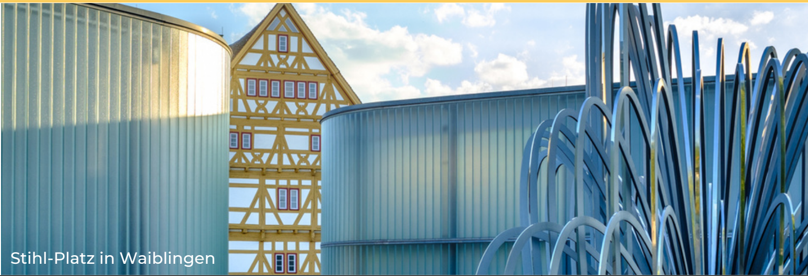
Stahl-Platz in Waiblingen

5. - 8. MAI 2024 | ZUSAMMENSTEHEN! | VHS FELLBACH