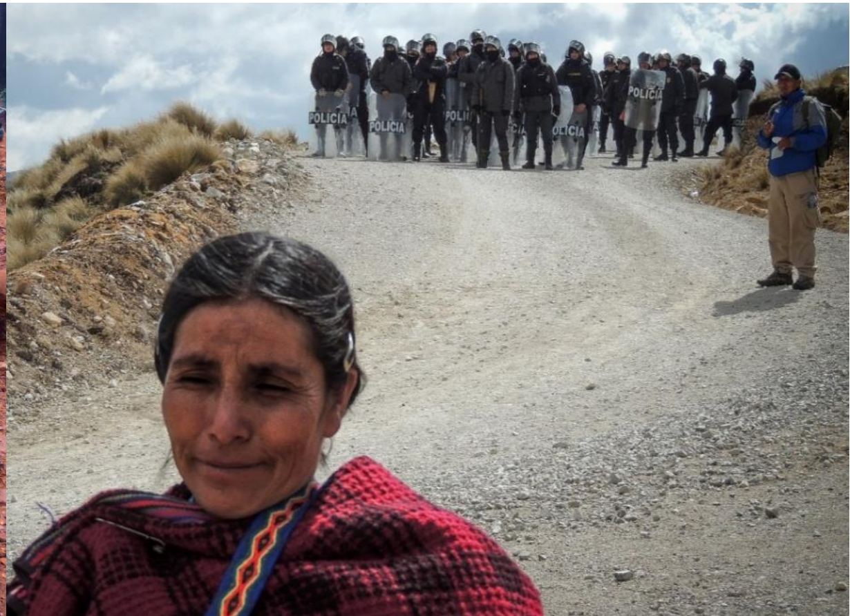
Protest gegen Bergbau in Peru