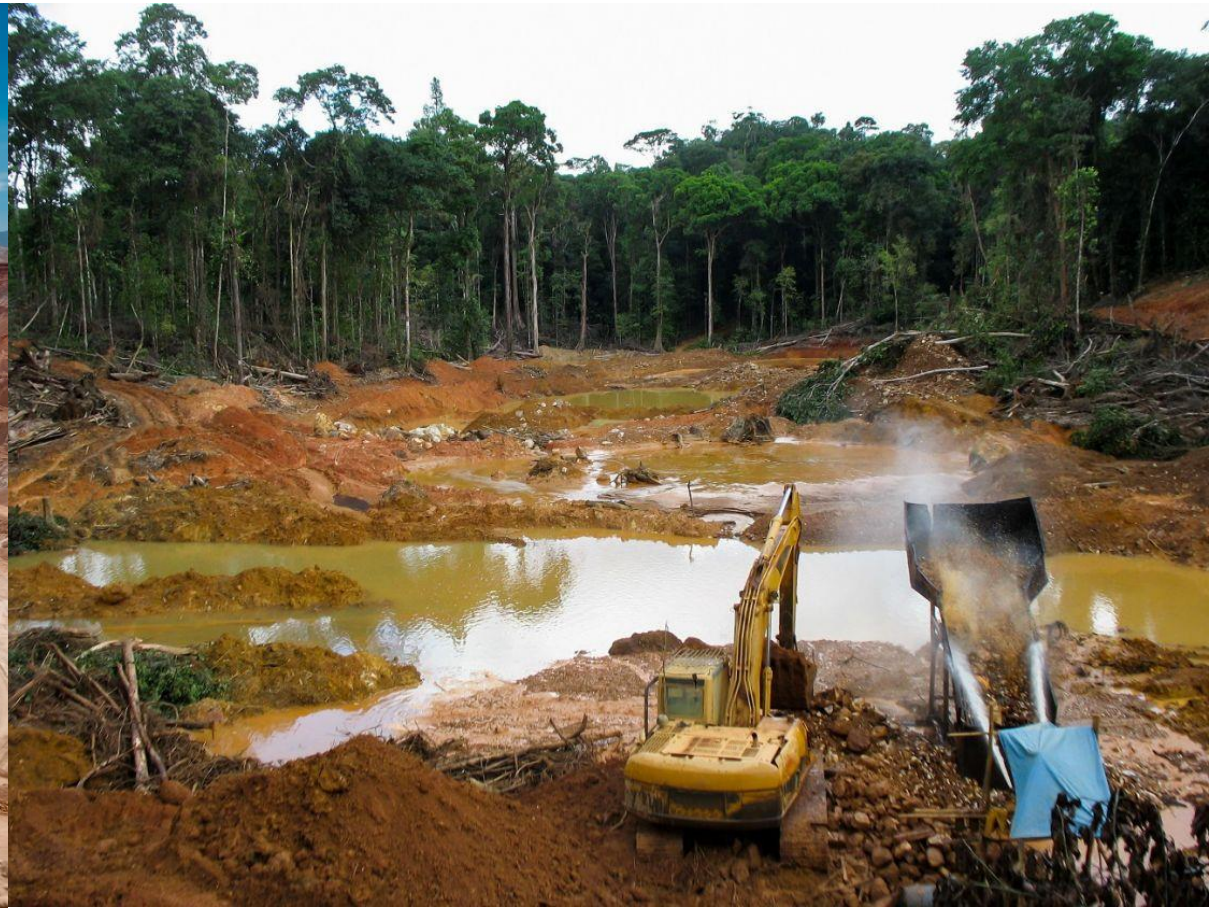
Goldabbau in Brasilien