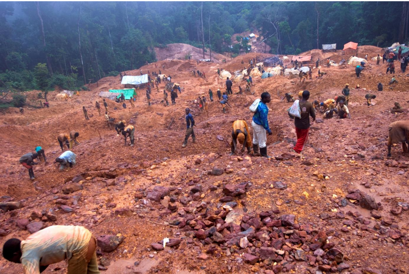
Kobaltabbau in der Dem. Rep. Kongo