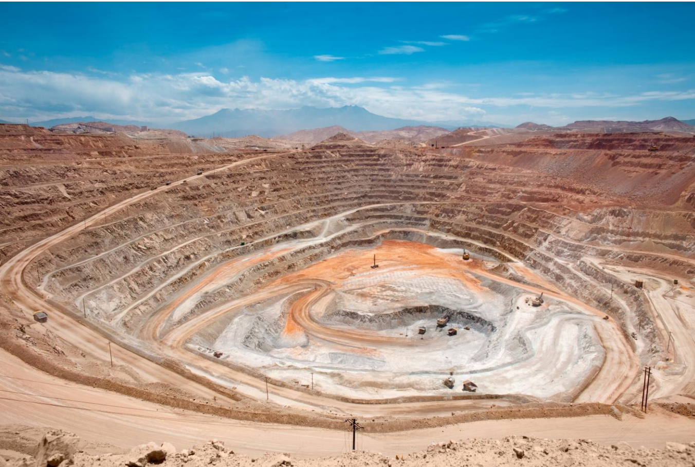
Kupfermine in Peru